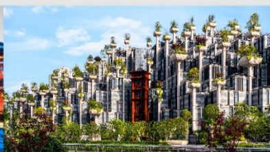
Tian An 1,000 Trees