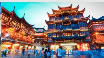
ตลาดร้อยปีเงินหวังเหมียว