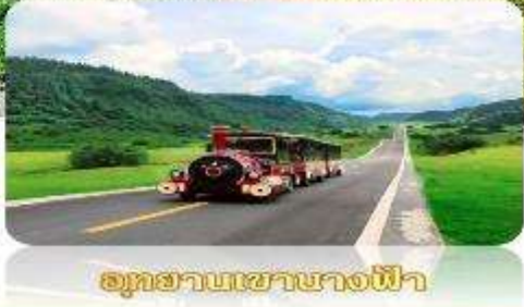
อุทยานเขานางฟ้า

เมนูพิเศษ สุกี้ยาล่ำ ชาบูไม่อื่น 6 วัน 5 คืน เดินทาง : เม.ย. – พ.ค. 68