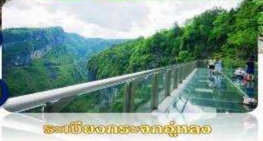
สะพานกระจกมองถ้ำหล่ง