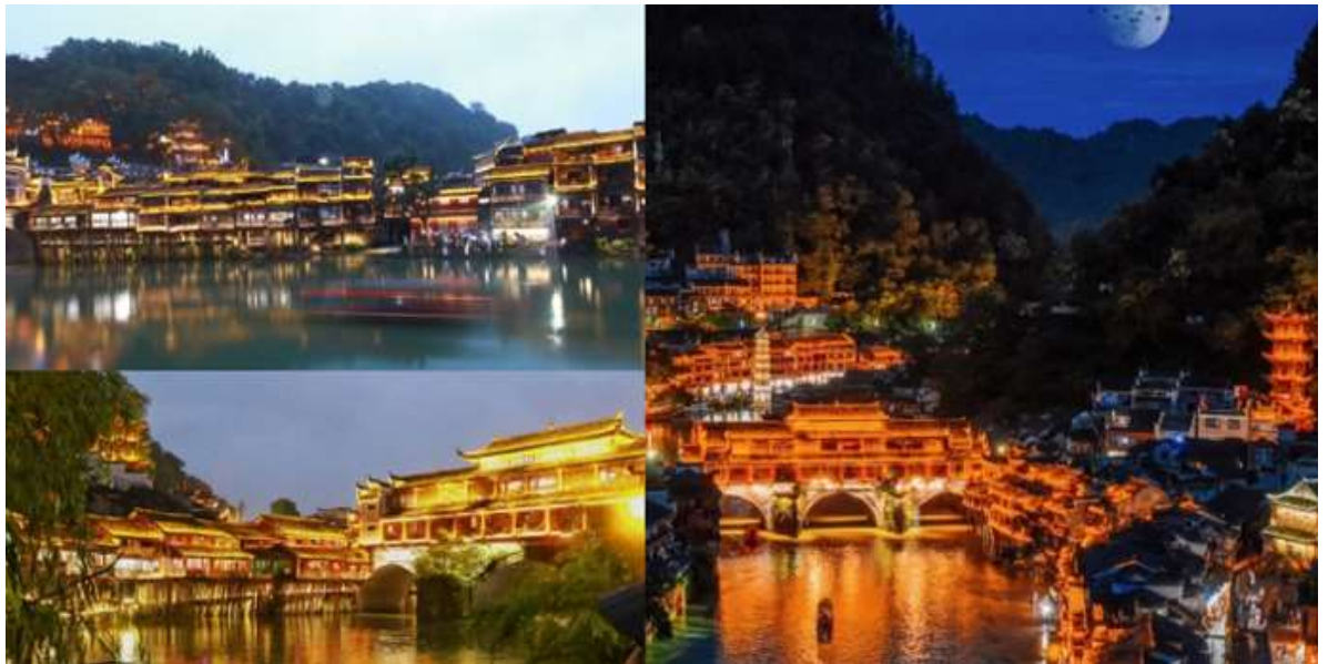
บ่าย นำท่านเดินทางสู่ เมืองเฟิ่งหวง (ระยะทาง 85 ก.ม. ใช้เวลาเดินทางประมาณ 2 ชั่วโมง) หรือ เมืองโบราณเฟิ่งหวง(เมืองหงส์) เป็นเมืองที่ขึ้น อยู่กับเขตปกครองตนเองของชนเผ่าน้อยยูเจีย ตั้งอยู่ ทางทิศตะวันตกของมณฑลหูหนาน เมืองโบราณหงส์ตั้งอยู่ริมแม่น้ำถั่ว ล้อมรอบด้วยขุนเขาเสมือนด่าน ช่องแคบภูเขา ที่เด่นตระหง่านมียอดเขาติดต่อกันเป็นแนว ที่มีโบราณสถานและโบราณวัตถุทางด้านวัฒนธรรมอันล้ำค่าที่ตกทอดมาจากราชวงศ์หมิงและชิงหลายร้อยแห่ง มีถนนที่ปูด้วยหินเขียว 20 กว่าสาย