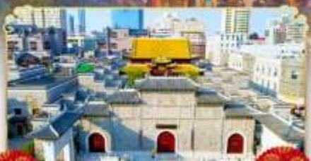
ถนนโบราณวังโซ่งกง