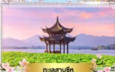
ทะเลสาบซีหู

• เที่ยวมหานครเซี่ยงไฮ้ ช้อปปิ้งถนนโบราณ