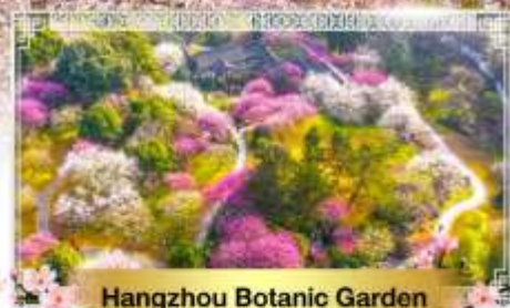
Hangzhou Botanic Garden