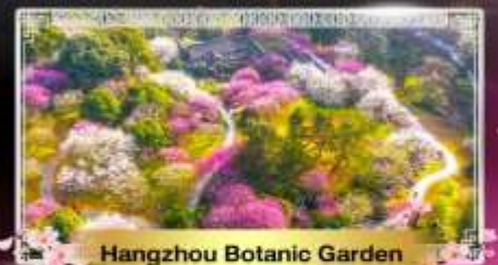
Hangzhou Botanic Garden