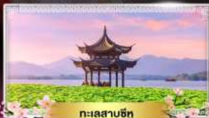
ทะเลสาบซีหู