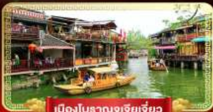
เมืองโบราณจูเจียเจี้ยว

เที่ยวสนุกในฝัน "ดิสนีย์แลนด์" ล่องเรือชมเมืองโบราณจูเจียเจี้ยว