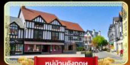
หมู่บ้านอังกฤษ