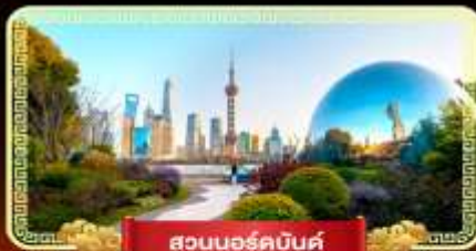
สวนนอร์คบันด์