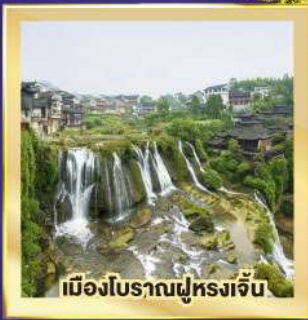
เมืองโบราณฝูหรงจั้น