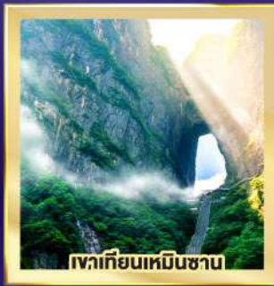
ทะเลเทียนเหมินซาน