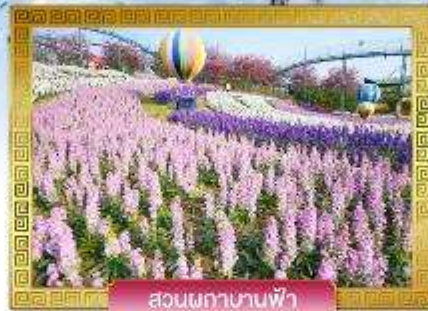
สวนผักกาดบานฟ้า