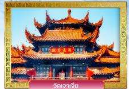
วัดเจาเจีย