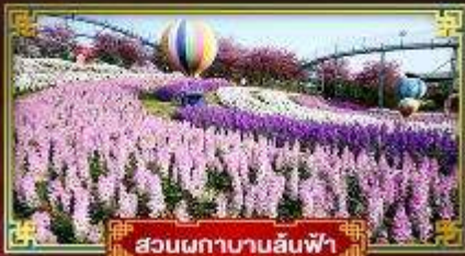
สวนผักบานสีฟ้า

อุทยานสวรรค์กุหาหิมะการ์เซียคำกู่ปิงชว่น