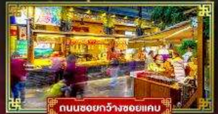
ถนนชอยกวางชอยแคบ