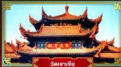
วัดเจเจีย