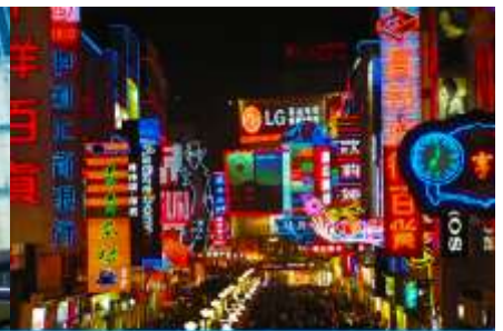
ถนนคนเดินซุนซีลู่