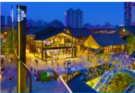
ถนนไท่กู่หลี่ และวัดต้าเจี๋ย