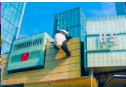
หมีแพนด้าปิ่นตึก ณ ตึก IFS