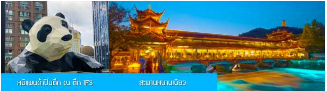
หมีแพนด้าปิ่นตึก ณ ตึก IFS

หลังอาหารนำท่านเดินทางสู่ เมืองตูเจียงเยียน 都江堰 (ระยะทาง 234 กม. ใช้เวลาเดินทางราว 4 ชั่วโมง) ระหว่างเดินทางท่านสามารถชมทัศนียภาพธรรมชาติอันงดงามของสองข้างถนนขณะที่รถแล่นผ่าน ที่มีทั้งภูเขา หิมะสูง หุบเขา ธารน้ำ และทุ่งหญ้าบนที่ราบสูง หรือพักผ่อนตามอัธยาศัยบนรถระหว่างเดินทาง