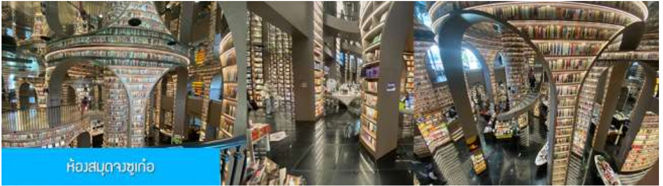
ห้องสมุดจวงซูเก่อ

วันที่สี่ เมืองตู่เจียงเยียน-ห้องสมุดจวงซูเก่อ -เมืองเจิงตู- ถนนไท่กู่หลี่-วัดต้าฉือ-หมีแพนด้าปิ่นตึก-อิสระ ซ้อป๋ิง ฉ ฉนวนชุนซีลู่ – บินกลับกรุงเทพฯ