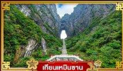
เทียนเหมินชาน

ขึ้นกระเช้าที่ยาวที่สุดในโลก “สู่ภูผาประตูสวรรค์”