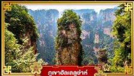
ภูผาฮัลเลอฮ่าห์