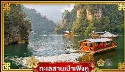
ทะเลสาบเป่าเฟิงหู