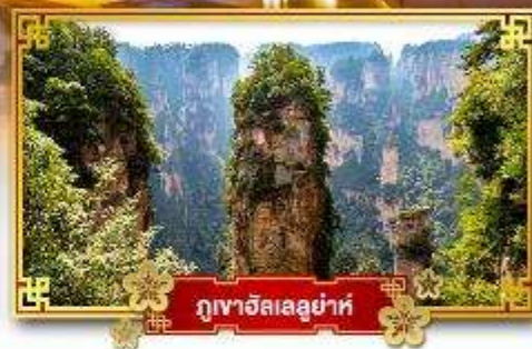
ภูเขาอัลเลอูย่าห์