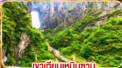
เขาเทียนเหมินซาน