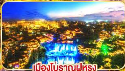
เมืองโบราณฟูหรง