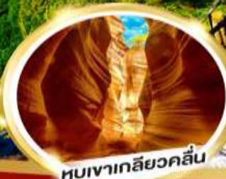
หุบเขาเกลียวคลื่น