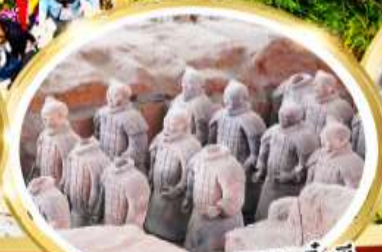
กองทัพทหารดินเผาจีนซี