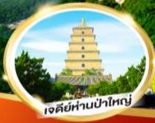
เจดีย์ห่านป่าใหญ่