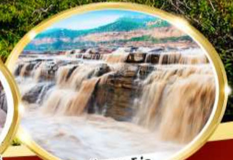
น้ำตกหูโข่ว