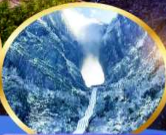
ประตูล่องเรือ เขียนหมื่นต้น