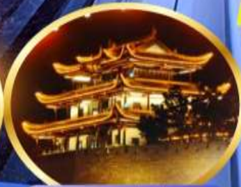
หอคอยทองคำเขียนซัน