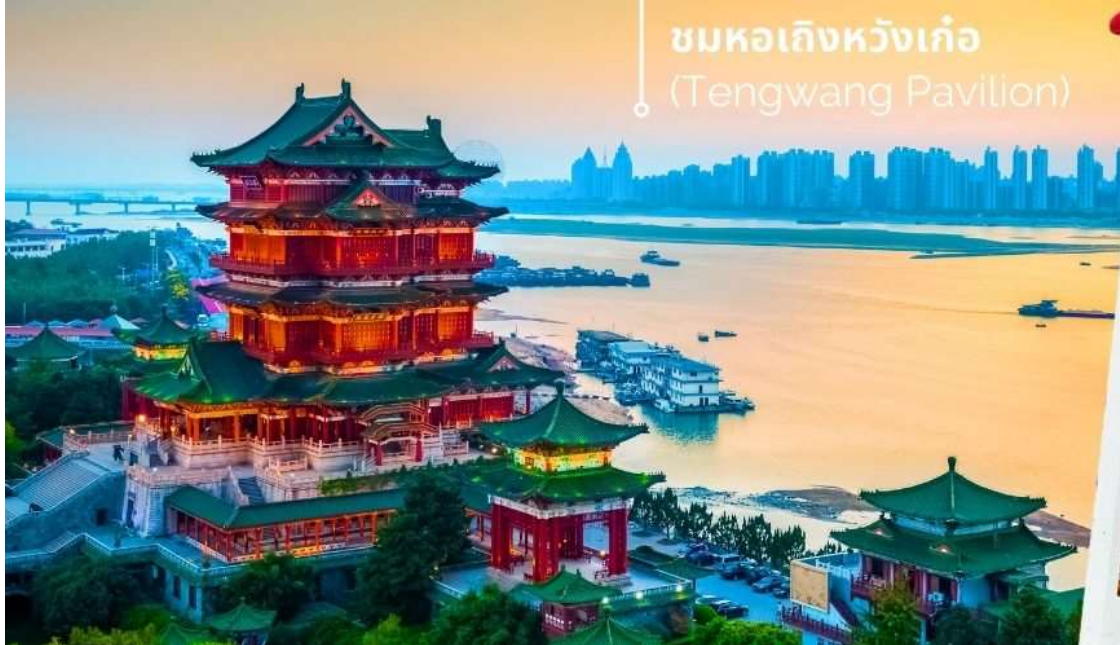
ชมหอเถิงหวังเก้อ (Tengwang Pavilion)

ออกเดินทาง สู่เมืองหนานซาง โดยใช้เวลาเดินทางประมาณ 4-5 ชั่วโมง ชมหอเถิงหวังเก้อ (ถ่ายรูปด้านนอก) เถิงหวางเก้อตั้งอยู่ที่ริมแม่น้ำกานเจียงเริ่มสร้างเมื่อปี ค.ศ.635 สมัยราชวงศ์ถัง โดย ลี ยวนยิง น้องชายของจักรพรรดิ