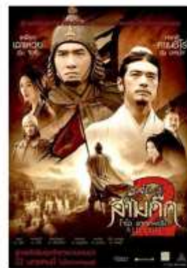
ภาพยนตร์และซีรีส์ชื่อดัง ถ่ายทำที่ Hengdian World Studios