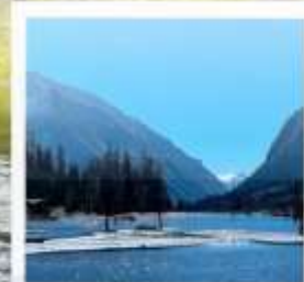
อุทยานชวงเฉียวโกว