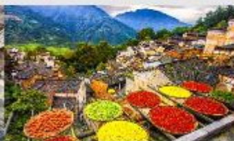
หมู่บ้านหวงหลิง