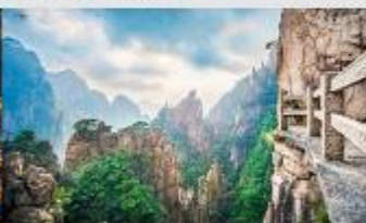
เขาหวงชาน