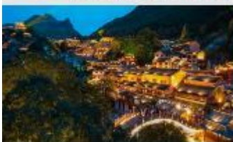
หุบเขาเทวดาวังเซียนกู่