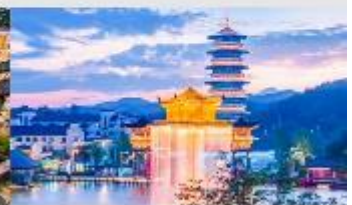
ล่องเรือหัวนี้โจว

*ทางบริษัทฯ ขอสงวนสิทธิ์ในการปรับเปลี่ยนโปรแกรมทัวร์ตามความเหมาะสมขึ้นอยู่กับสถานการณ์หน้างาน โดยคำนึงถึงผลประโยชน์ของลูกค้าเป็นสำคัญ