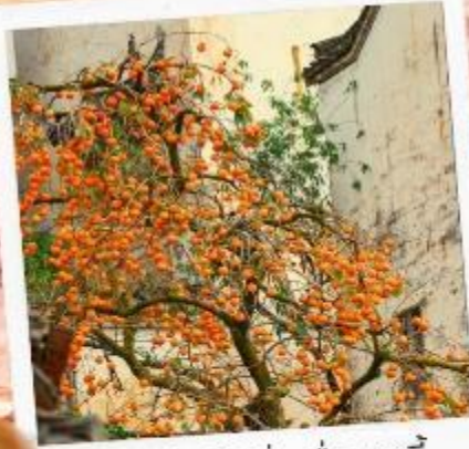
柿柿如意 ชื่อ ชื่อ หยูอี้ ลูกพลับแห่งความราบรื่น