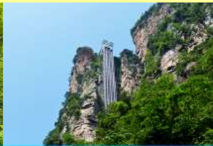
ลิฟท์แก้วไปหล่ง