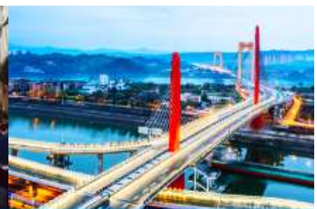
เมืองหยี่ซา