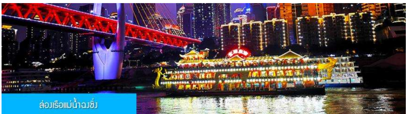
ล่องเรือแม่น้ำฉงชิ่ง