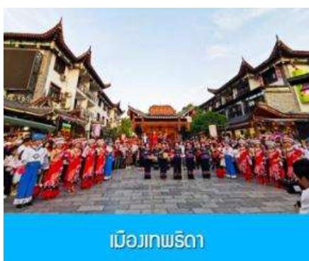
เมืองเทพริดา