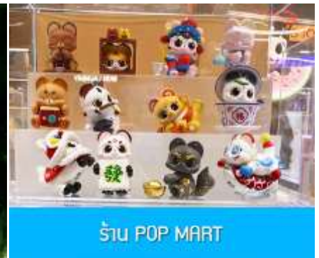
ร้าน POP MART

วันที่ห้า เมืองเอินชือ – อุทยานตี้ซินกู่ (โกรกหัวใจ) – เมืองหยีซัง – ซุปเปอร์มาร์เก็ต CBD – POP MART