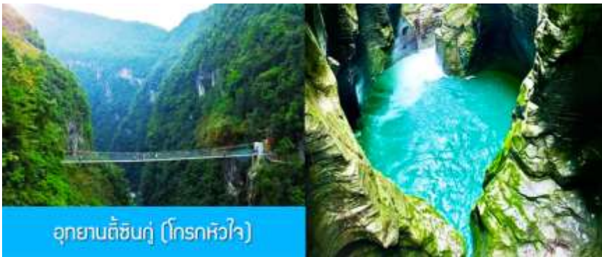
อุทยานตี้ซินกู่ (โกรกหัวใจ)

พักที่ โรงแรม ENSHI XIPU HOTEL ระดับ 4 ดาวท้องถิ่นหรือเทียบเท่าในเมืองเอินชือ