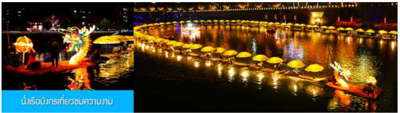
นั่งเรือมังกรเที่ยวชมความงาม

หลังอาหารนำท่านเดินทางเข้าที่พัก หรือท่านสามารถเลือกซื้อ โปรแกรมเสริม เป็นตัวนั่งเรือมังกรที่วชมความงามของ บ้านเรือนและสิ่งปลูกสร้างสองฝั่งแม่น้ำในช่วงที่สวยงามที่สุดของเมือง เซียนเอิน ที่ประดับประดาด้วยแสงสี และได้ชื่อว่าเป็นวิวยามค่ำคืนที่สวยงามที่สุดในมณฑลหูเป่ย์ เช่นเดียวกับเมือง โบราณฟงหวงในมณฑลหูหนาน.....อัตราค่าบริการสำหรับ โปรแกรมเสริมนั่งเรือมังกรชมวิวยามค่ำคืน ท่านละ 190 หยวน หรือ 950 บาท ระยะเวลาที่ใช้ในการเรือมังกร ประมาณ 45 นาที ค่าบริการรวม ค่าบัตรเข้าชม ค่ารถรับ ส่ง และค่าน้ำดื่มของไกด์ท้องถิ่น