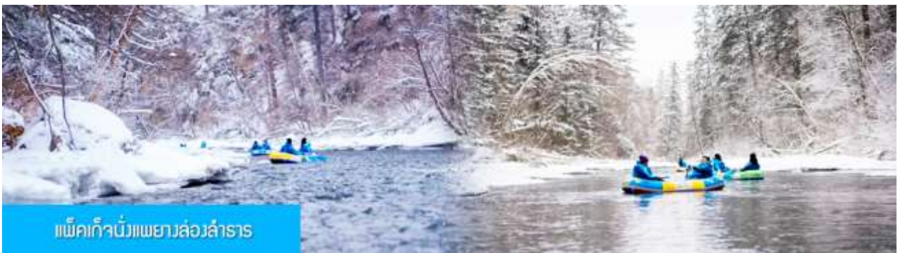
แพ็กเกิ้งนั่งแพยางล่องลำธาร

พักที่ QIUSHA MEISHU HOTEL โรงแรมระดับ 4 ดาวท้องถิ่นหรือเทียบเท่า ในเมืองฉางไป๋ซาน