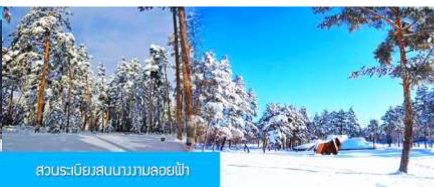
สวนระเบียงสนนางงามลอยฟ้า