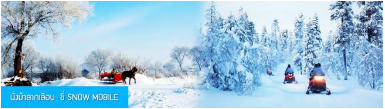
นั่งม้าลากเลื่อน ชီး SNOW MOBILE

หมายเหตุ การเดินเที่ยวชมอุทยานทำได้ด้วยการเดินเท้า เข้าและออกจากอุทยานซึ่งจะใช้เวลาเข้าไป 40 นาที ขากลับ 40 นาที ระหว่างทางต้องลุยหิมะแต่สามารถชมและถ่ายภาพวิวหิมะได้ตลอดทาง และท่านสามารถ เลือกซื้อ OPTION เสริมที่ 1 ด้วยการนั่งม้าลากเลื่อน 1 ขา 马拉雪橇 (ใช้เวลา 15 นาทีอัตรา ค่าบริการท่านละ 240 หยวนหรือ 1,200 บาทต่อเที่ยว)