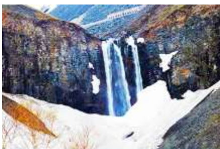
น้ำตกฉางไป่ซาน

พักที่ QIUSHA MEISHU HOTEL โรงแรมระดับ 4 ดาวห้องถื่นหรือเทียบเท่า ในเมืองฉางไป่ซาน