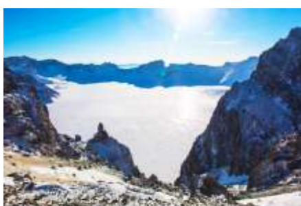
ทะเลสาบเทียนฉือ

อุทยานท่องเที่ยวธรรมชาติฉางไป่ซาน 长白山景区 แหล่งท่องเที่ยวธรรมชาติและเป็นภูเขาศักดิ์สิทธิ์สำหรับชาวจีนและชาวเกาหลี ภูเขานี้ตั้งอยู่บนเทือกเขาฉางไป่ซานที่ทอดยาวจากด้านทิศตะวันตกเฉียงใต้ ไปยังด้านทิศตะวันออกเฉียงเหนือด้วยความยาวกว่า 1,000 กิโลเมตร แนวเทือกเขาพาดผ่านพื้นที่ทางภาควันออกเฉียงเหนือของจีนและพื้นที่ทางตอนเหนือของประเทศเกาหลีเหนือ ประกอบด้วยยอดเขาทั้งหมด 16 ยอด ยอดเขาฉางไป่ซานเป็นยอดเขาที่สูงที่สุดด้วยความสูง 2749 เมตร เมื่ออยู่บนยอดเขาสามารถมองเห็น ทะเลสาบเทียนฉือ 天池 ทะเลสาบที่เกิดจากการระเบิดของภูเขาไฟ และเป็นทะเลสาบบนยอดเขาที่มีความสูงเหนือระดับน้ำทะเล 2194 เมตร อีกทั้งเป็นทะเลสาบที่ลึกที่สุดในประเทศจีน โดยมีจุดที่ลึกที่สุดคือ 373 เมตร