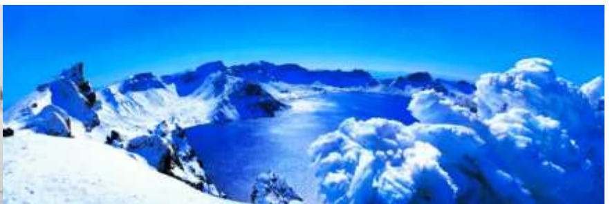
อุทยานก่องกั๋วยวรรรชชาติถาวปีซาบ