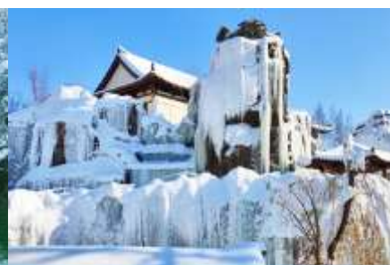
หมู่บ้านวัฒนธรรมเกาหลี