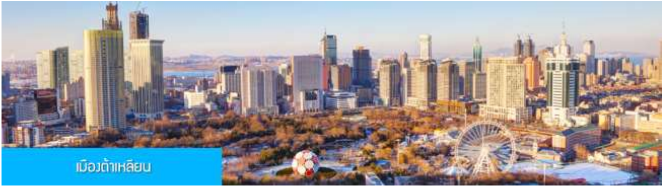
เมืองต้าเหลียน