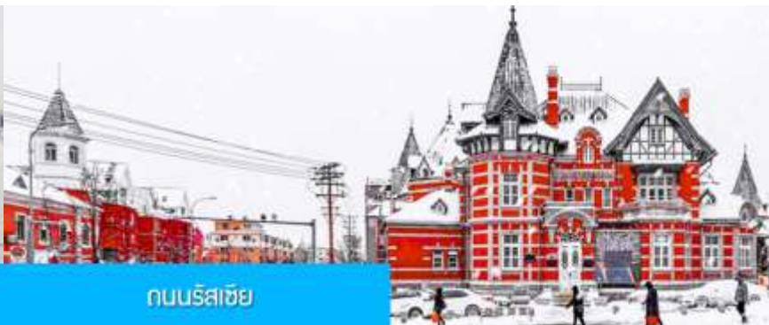
ถนนรัสเซีย