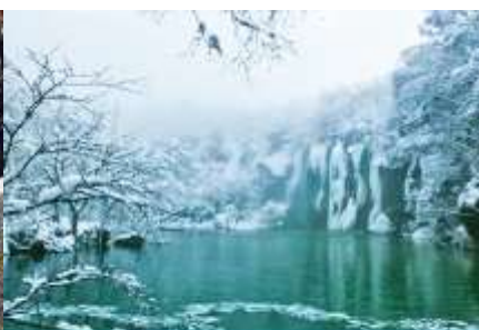
สะพานรถ ฉางไป่ซาน