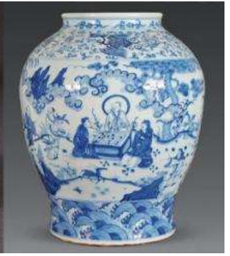
เตาเผาเครื่องลายครามจีนโบราณ

หลังอาหารนำท่านชม เตาเผาเครื่องลายครามจีนโบราณ 景德镇官窑 เป็นโรงงานผลิตเครื่องลายครามจีนโบราณที่ผลิตเครื่องใช้ต่าง ๆ (เครื่องลายคราม) อาทิ แจกันประดับบ้าน ถ้วยชาม บรรจุภัณฑ์ที่ใช้ในบ้าน เพื่อส่งถวายให้เป็นเครื่องใช้ในวังสำหรับจักรพรรดิ และพระบรมวงศานุวงศ์ เครื่องลายครามที่ผลิตจากโรงงานแห่งนี้ได้ชื่อว่าเป็นเครื่องลายครามที่ดีที่สุดในพื้นที่จีน ซึ่งของที่ผลิตได้ทุกชิ้นหลังผ่านการคัดกรองแล้วจะถูกส่งไป ในพระราชวังที่กรุงปักกิ่ง ส่วนที่เหลือจากการคัดกรองจะถูกทุบให้แตกและนำมาเผาใหม่ โดยไม่สามารถนำไปขายให้กับสามัญชนทั่วไปได้.....นำท่านชมเตาเผาโบราณ และเครื่องลายครามโบราณรุ่นต่าง ๆ ซึ่งบางส่วนยังคงถูกเก็บรักษาไว้เป็นอย่างดี