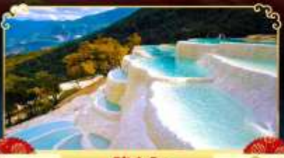
โป๋สูยโก

นั่งกระเช้าขึ้นหุบเขาพระจันทรสีน้ำเงิน ชมวิว "นาพาไห่" ทะเลสาบทุ่งหญ้าที่ดีที่สุด