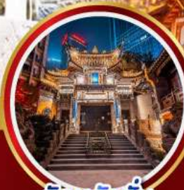
วัดหลัวฮัน