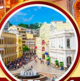
เซนาโดสแควร์