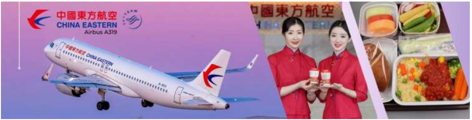
(บริการอาหารและเครื่องดื่มบนเครื่อง) (1)

วันที่สอง เชียงใต้-ฮู่ซี-วัดพระใหญ่หลิงซาน (นั่งรถราง)-ตำหนักผานกง หรือ ศาลาผานกง-ถนนคนเดินชิงหมิงเซียว-เข้าที่พัก