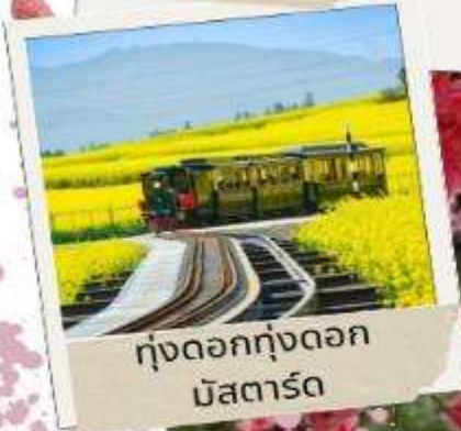
ทุ่งดอกทุ่งดอก มัสตาร์ด