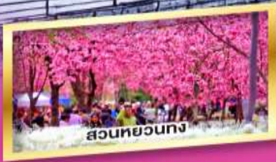
สวนหยวนทง