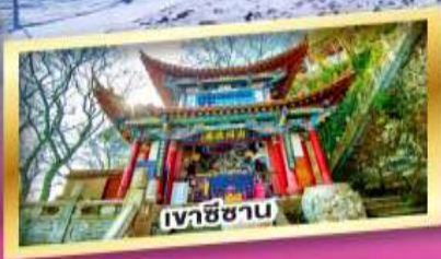
เวาชีซาน