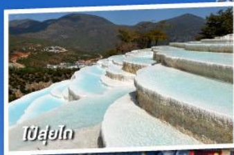
ลี่เจียง

เที่ยวครบทุกไฮไลท์ • ไม่ลงร้านช้อปปิ้ง • พักโรงแรม 4 ดาว