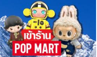
เข้าร้าน POP MART