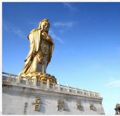
เกาะผู้ไถวซาน