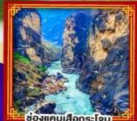
ช่องแคบเสื่อกรโง