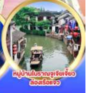
หมู่บ้านโบราณจูเจียเจี้ยว ล่องเรือแจว