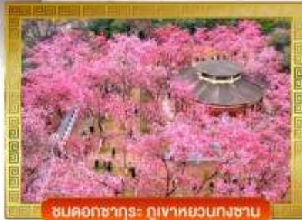
ชมดอกซากุระ ภูเขาหยวนกงซาน