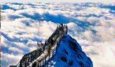
ภูเขาหิมะเจียวจื่อ