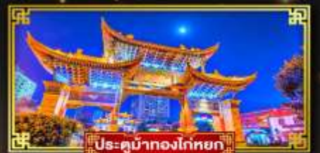
ประตูน้ำทองโก่หยก