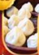
เสี่ยวหลงเป่า