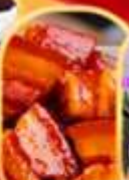
หมูคางพอ