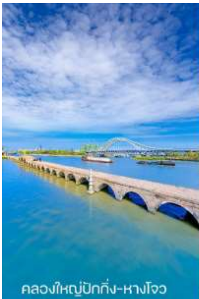
คลองใหญ่ปักกิ่ง-หางโจว

กลางวัน ๑๐) บริการอาหารกลางวัน ณ ภัตตาคาร