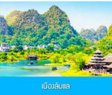
เมืองลิบแล