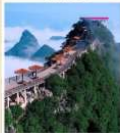
เขาหลุยี่