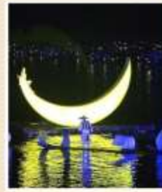
IMPRESSION LIU SANJIE