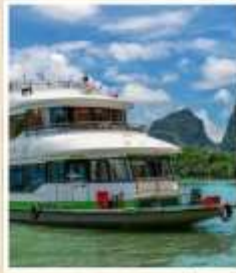
ล่องเรือแม่น้ำ หลีเจียง