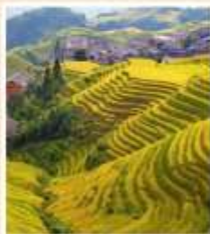
นาขั้นบันไดหลงจี้