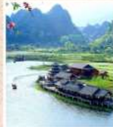
เมืองลับแล