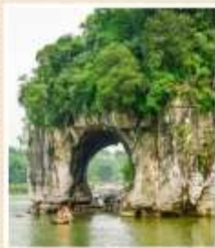
เงาวงช้าง