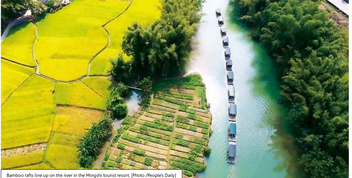
Bamboo rafts line up on the river in the Mingshi tourist resort.

แม่น้ำหมิงซือ Mingshi มีต้นกำเนิดในเวียดนาม และไหลจาก Niandoutun เข้าสู่ประเทศจีน ซึ่งไหลไปทางตะวันออกเฉียงใต้ Jingtang, Mingshi, Kanwei, Lushan, Houyi ฯลฯ ในที่สุดแม่น้ำหมิงซือก็นำมาบรรจบกับแม่น้ำเฮยสุ่ย มีความยาวทั้งสิ้น 44.13 กิโลเมตร