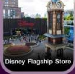
Disney Flagship Store