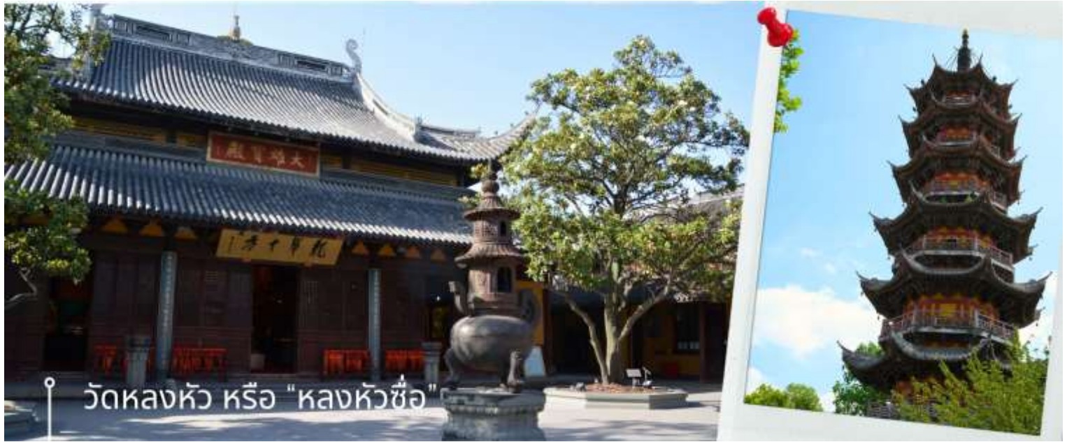
วัดหลงหัว หรือ "หลงหัวชื่อ"

พระพุทธรูปที่มีประติมากรรมสวยงามประดิษฐานอยู่ เช่น องค์เจ้าแม่กวนอิมพันมือ, พระสังกัจจายน์ ให้ท่านได้ไหว้สักการะและชื่นชมความงาม