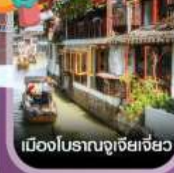
เมืองโบราณจูเจียเจี๋ย