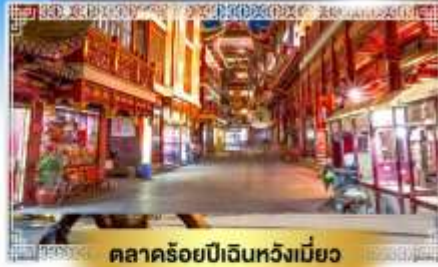
ตลาดร้อยปีเงินหวังเมี่ยว