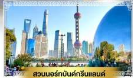
สวนออร์บดินด์กรีนแลนด์