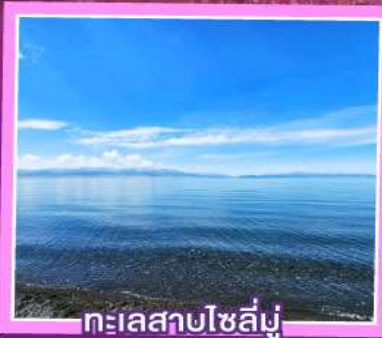
ทะเลสาบโซลิมู