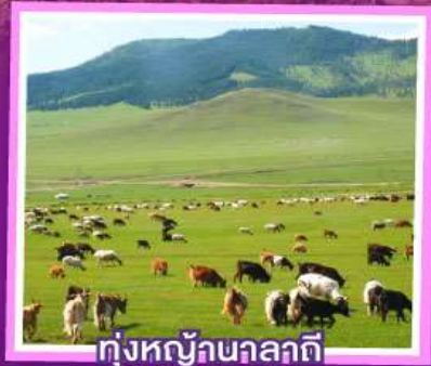
ทุ่งหญ้าขาลลาคี