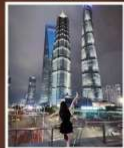
SKYWALK ลู่เจียจู่ย

รับฟรี!! ประกันสุขภาพ และ อุบัติเหตุ 2 ล้านบาท