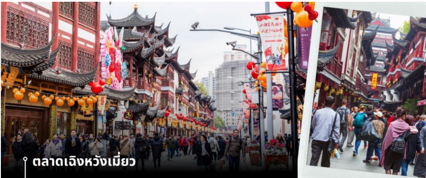
ตลาดเงินหวังเหมียว

เที่ยง 📍รับประทานอาหารกลางวันที่ภัตตาคาร (4) นำท่านเดินทางกลับสู่มหานครเซี่ยงไฮ้ โดยใช้เวลาเดินทางประมาณ 2 ชั่วโมง จากนั้นนำท่านชม ตลาดเงินหวังเหมียว หรือเป็นที่รู้จักในชื่อ ตลาด 100 ปี เงินหวังเหมียว เมืองเซี่ยงไฮ้ (Chen Wang Miao) ถือว่าเป็นตลาดเก่าของผู้ตั้ง เมืองเซี่ยงไฮ้ อาคารบ้านเรือนบริเวณนี้เป็นสถาปัตยกรรมโบราณสมัยราชวงศ์หมิงและชิง ตกแต่งสไตล์สถาปัตยกรรมแบบโบราณจีน และเก่ากว่าร้อยปี