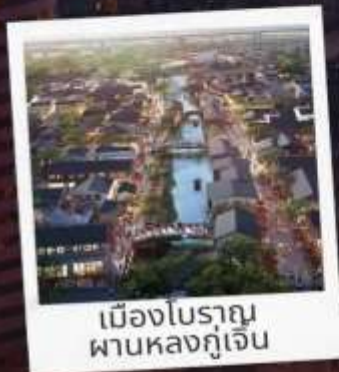
เมืองโบราณ ผานหลงกุเจิน