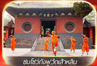
ชมโชว์กังฟูวัดเล้าหลิน