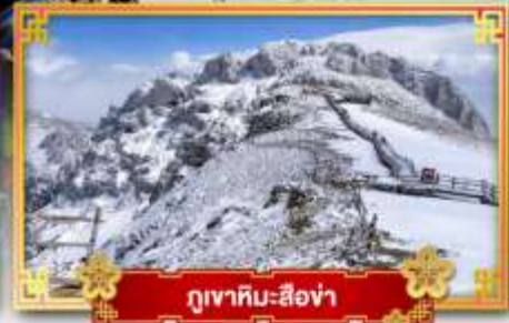
ภูเขาหิมะซือซ่า