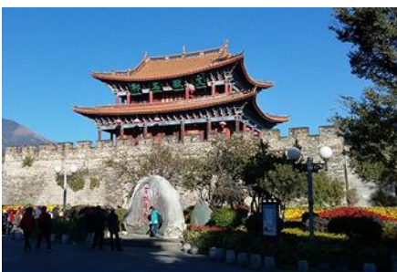
เมืองโบราณต้าลี่

ค่ำ รับประทานอาหารค่ำ ณ ภัตตาคาร หลังอาหารนำท่านเข้าสู่ที่พัก พักที่ DALI ZHUANG HOTEL ระดับ 4 ดาวหรือเทียบเท่าในเมืองต้าลี่