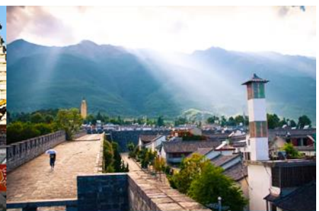
หมู่บ้านซีโจว(หมู่บ้านชาป๋อ)