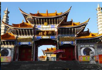
วัดเจ้าแม่กวนอิมเปลงกาย