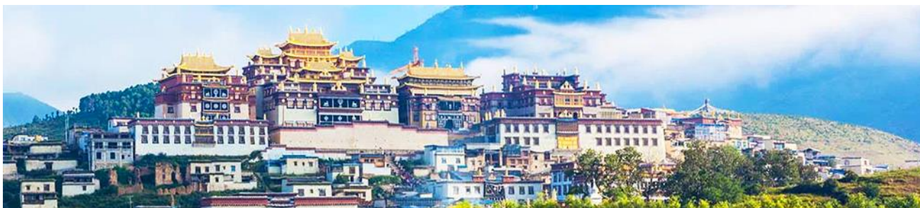
เมืองโบราณแชงกรีล่า

จากนั้นนำท่านเดินทางสู่ เมืองจางเตี้ยน โดยใช้เส้นทางด่วนวิ่งตรงเข้าเมือง จางเตี้ยน ใช้เวลาเดินทางประมาณ 2 ชั่วโมง สู่ เมืองจางเตี้ยน หรือดินแดนแห่งแชงกรีล่า ซึ่งอยู่ทางทิศตะวันออกเฉียงเหนือของมณฑลยูนนานซึ่งมีพรมแดนติดกับอาณาเขตน่านซี ของเมืองลี่เจียง และอาณาจักรหิ ของเมืองหนิงหลง สถานที่แห่งนี้จึงได้ชื่อว่า ดินแดนแห่งความฝัน