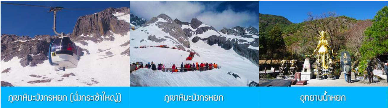
ภูเขาหิมะมังกรหยก (นั่งกระเช้าใหญ่)

ที่พัก FENG HUANG HOTEL ระดับ 4 ดาว หรือเทียบเท่าเมืองลี่เจียง